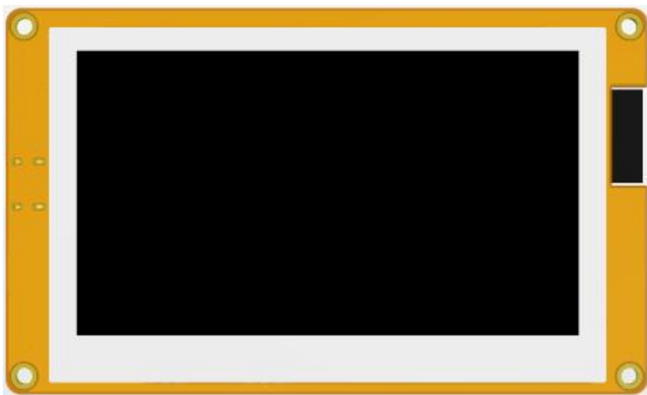
图 3.1 模块硬件资源 1